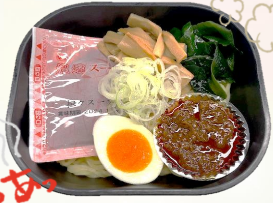
坦々麺 お値段 520円(税込)