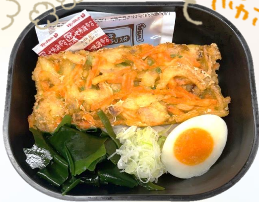
鍋焼き風うどん お値段 520円(税込)